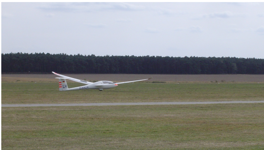
Figura 1: Pouso de planador na competição de 2008 em Lüsse, Alemanha.

O objetivo desta aula prática começar a usar o MATLAB para aplicações de mecânica do voo. Inicialmente, você criará a tabela que relaciona uma atmosfera real (dadas a temperatura de operação e a altitude-pressão da